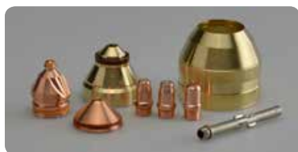
Verschleißteile mit langer Lebensdauer Consumables with long life