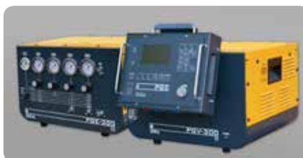
Gasversorgung manuell: PGE-300, automatisch: PGV-300 Gas supply manual: PGE-300, automated: PGV-300