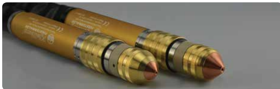
PerCut-Brenner: auch für Fasenschnitte bis 50 ° | PerCut torches: also for bevel cutting up to 50 °

Newly developed gas supply units are available for the Smart Focus series, either manual or fully automated. With these the user achieves best cutting results with highest, reproducible quality. The new torches PerCut 2000 and PerCut 4000 have been improved as well. They provide precise cuts and highest cutting speeds. Their unique cooling system guarantees longest consumable life and reduces the gas consumption and cutting costs per metre.